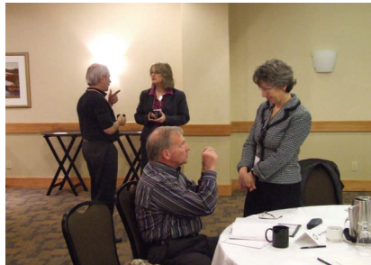
Photographie (de g. à dr.)